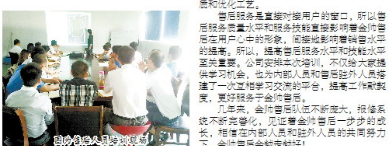
图为售后人员培训现场。

本报讯(朝秀秀 朱年) 2012年秋季订货会议已经结束, 洗衣机新产品也已成功推广并批量生产, 冰箱的技改工作即将开展, 借此之际销售公司售后服务部于9月份开展一次售后服务人员赴安徽工厂的集中培训和交流。