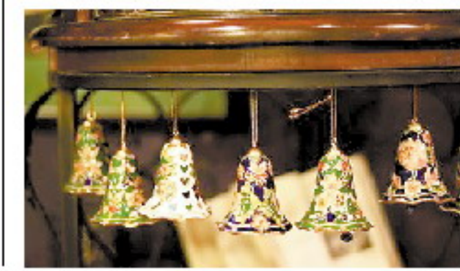
冷飕飕的秋季又到了, 人们感到一阵凉意, 有些人又出现手脚冰凉、手脚裂口子、遇寒咳嗽的症状。中医认为, 这些人不妨每晚用中药泡脚, 可有效缓解这些症状。

大学刚一毕业我就被推荐在合肥一家做冰箱内胆的私人公司上班。干了半年, 把我分配到综合办负责管理后勤和人事。由于公司不大, 食堂买菜的事就叫我和烧饭的阿姨负责了。就在这个时候我认识了食堂的那个阿姨。