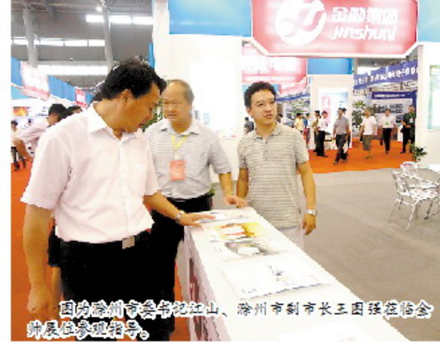
图为滁州市副市长王国强在滁州金帅展位参观指导。

本报讯(滁州金帅电器 朱年) 9月6日上午, 第六届中国(合肥)国际家用电器博览会隆重开幕。近400家国内外家电企业带来了自己最新、最先进的产品, 参展企业不仅包括三星、松下、佳能、东芝、索尼等10个国际知名品牌, 还有格力、TCL、格兰仕、海尔、海信、美的、长虹、美菱、美事达、康佳等众多国内知名品牌。金帅冰箱、洗衣机也应邀参加本届展会。